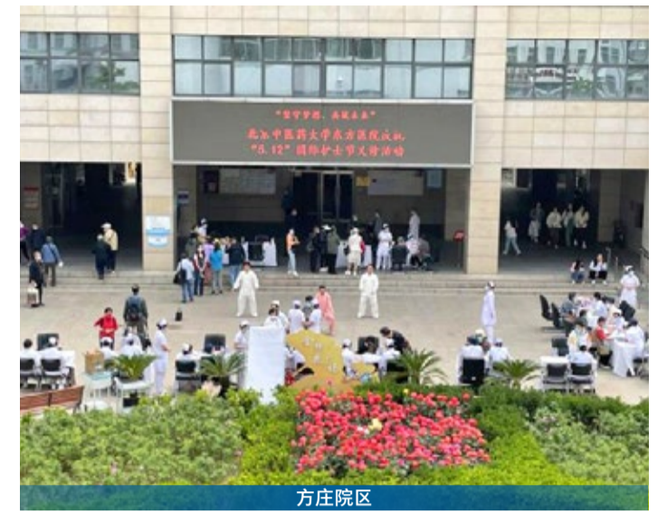
方庄院区 经开院区区 进行耳穴贴压、平衡火罐、火龙灸等中医特色护理技术，真正展现了中医特色护理技术“简、便、廉、验”的效果，深受广大人民群众的认可与支持。

为纪念第112届“5.12”国际护士节，弘扬护理正能量，发挥中医护理在疾病预防、治疗、康复等方面的重要作用，用高质量的护理服务增进人民健康福祉。2023年5月11日北京中医药大学东方医院在一院三区范围内开展以“坚守梦想、共筑未来”为主题的义诊活动，提供健康咨询及中医特色护理技术体验共700余人次。 方庄院区 此次义诊在金银花广场举行，由呼吸科、肿瘤科、肛肠科、心血管科、脾胃肝胆科、脑病一科、脑病二科、外四科、内分泌科、妇科、外一科、外二乳腺科、疼痛科、治未病科医护人员共同围绕健康咨询、中医特色护理技术体验、中医功法进行健康指导，针对义诊群众提出的健康问题逐一进行个性化、针对性指导，现场为大家讲解经络知识，指导简便易行的中医保健方法，传递专业的健康知识及科学健康的生活方式，切实提高广大群众的健康素养，中医护理专家们为前来咨询的群众提供耳穴贴压、全息刮痧、头痛推拿、便秘推拿、小儿推拿、蜜芽罐等多项中医特色护理技术体验，让广大民众零距离了解中医知识，感受中医文化，体验中医特色护理技术的独特魅力。