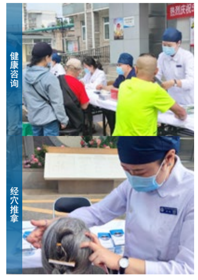
西院区 活动特邀了综合外科、脑病康复科、肾内科、脾胃肝胆科多位资深专家参与。又义诊现场气氛融洽，中医绿色护理门诊护士以娴熟的技术手法让体验者切身感受耳穴贴压这项中医护理技术的实际效果；康复专科护理门诊护士耐心的向中风患者及家属讲解病后的康复护理知识；综合外科的护士详细讲解门诊手术前后的注意事项；内镜中心护士向很多咨询者讲解胃肠镜检查的必要性；透析室护士耐心地给透析患者及家属做思想工作，帮他们树立战胜疾病的信心。