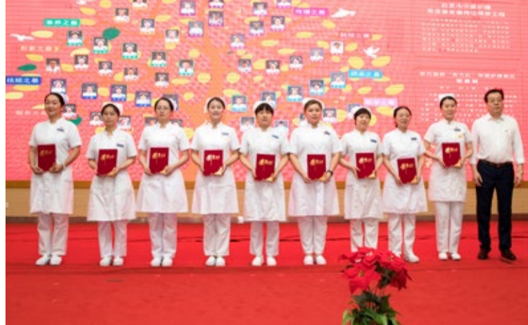
柏立群院长助理为“教学之最、传播之最”颁奖