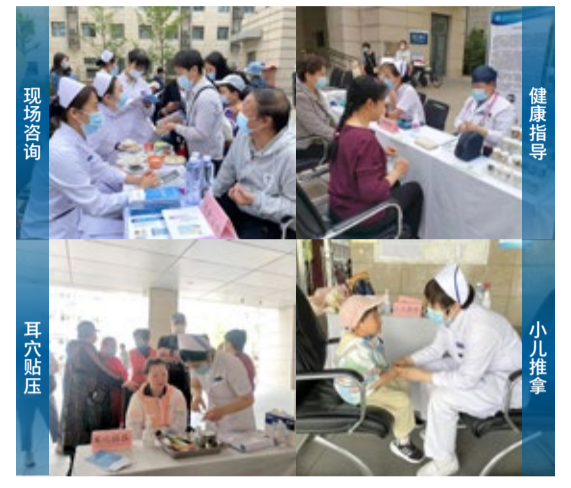
现场咨询 健康指导 耳穴贴压 小儿推拿

为纪念第112届“5.12”国际护士节，弘扬护理正能量，发挥中医护理在疾病预防、治疗、康复等方面的重要作用，用高质量的护理服务增进人民健康福祉。2023年5月11日北京中医药大学东方医院在一院三区范围内开展以“坚守梦想、共筑未来”为主题的义诊活动，提供健康咨询及中医特色护理技术体验共700余人次。 方庄院区 此次义诊在金银花广场举行，由呼吸科、肿瘤科、肛肠科、心血管科、脾胃肝胆科、脑病一科、脑病二科、外四科、内分泌科、妇科、外一科、外二乳腺科、疼痛科、治未病科医护人员共同围绕健康咨询、中医特色护理技术体验、中医功法进行健康指导，针对义诊群众提出的健康问题逐一进行个性化、针对性指导，现场为大家讲解经络知识，指导简便易行的中医保健方法，传递专业的健康知识及科学健康的生活方式，切实提高广大群众的健康素养，中医护理专家们为前来咨询的群众提供耳穴贴压、全息刮痧、头痛推拿、便秘推拿、小儿推拿、蜜芽罐等多项中医特色护理技术体验，让广大民众零距离了解中医知识，感受中医文化，体验中医特色护理技术的独特魅力。